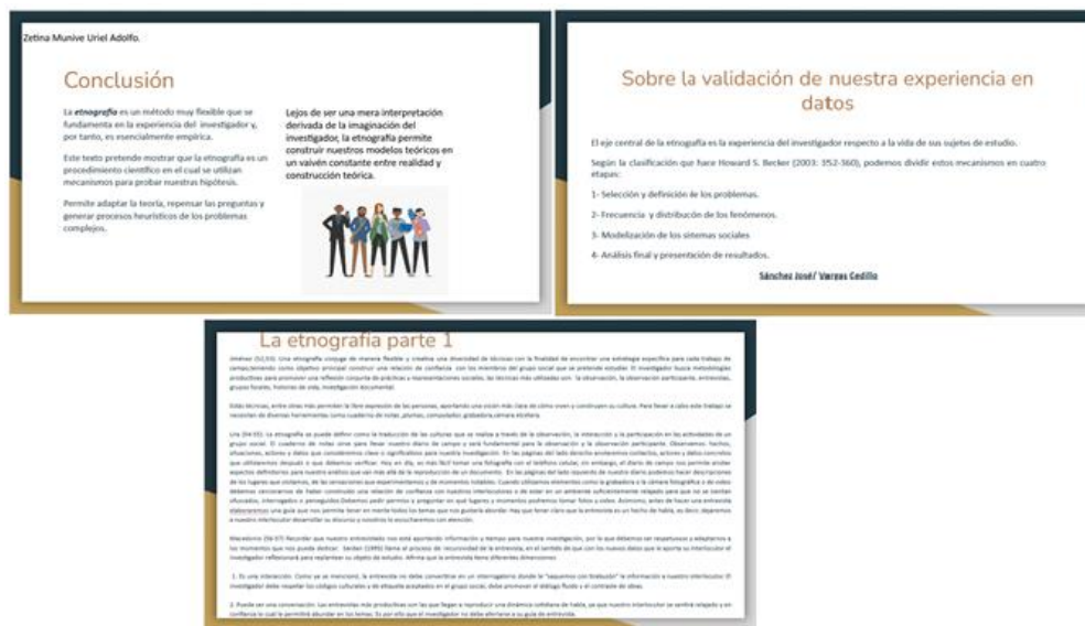
Figura 2. Presentación en google

Estas actividades contribuyeron al desarrollo de mi función docente. Me permitieron diseñar entornos de aprendizaje que consideran la utilización de los medios de comunicación y de las TIC, lo que ayudó a varios estudiantes a reforzar el aprendizaje que tenían y a otros a conocer y familiarizarse con estas herramientas.